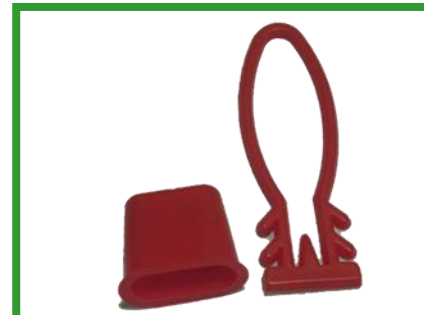
包裝網-蔬果網袋束頭