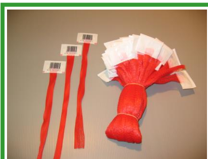
包裝網-熱封標籤網