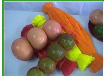
包裝網-伸縮蔬果網