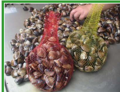
包裝網-水產類網袋