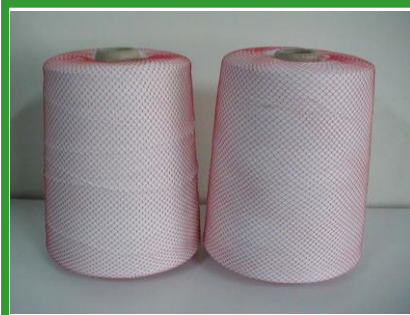
包裝網-織絲保護網