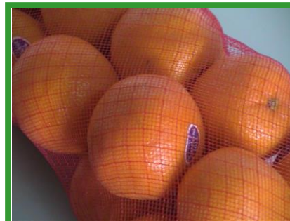
包裝網-加勁平面網