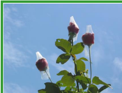
包裝網-鮮花保護網